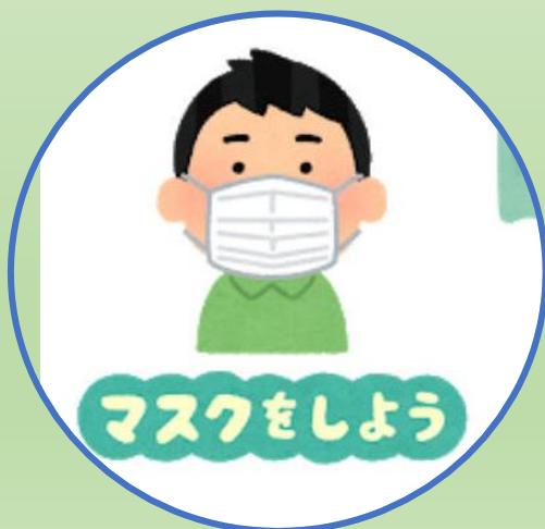
全スタッフマスク 着用