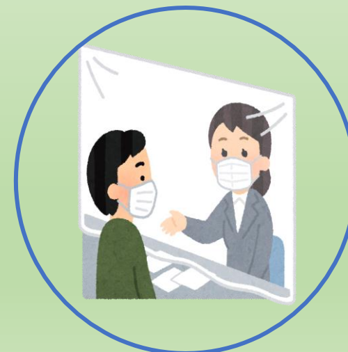
ビニールシートの 設置